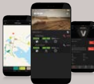
AGCO Telemetrie für Kunden Komplett kunden- und benutzerorientiert.

Valtra Connect ist unsere Telemetrielösung zum Aufzeichnen von Traktoraktivität und GPS-Bewegungen. Dank dieser Daten können Sie Ihre Pläne optimieren und entsprechend handeln. Mit Valtra Connect können Sie eine ganze Flotte überwachen und erhalten Statusinformationen in Echtzeit auf Ihr mobiles Gerät geliefert. Zusätzlich können Sie Leistungsberichte erstellen, die auf einen von Ihnen gewählten Zeitrahmen zugeschnitten sind. Diese Berichte können zur einfachen Weitergabe auch als PDF-Dateien exportiert werden. Greifen Sie jederzeit und überall auf Ihre Daten zu. Die Geofencing-Funktion benachrichtigt Sie, wenn einer Ihrer Traktoren ein bestimmtes Gebiet verlässt. Das erhöht die Sicherheit und schützt Ihre Investition. Anhand der Diagnosedaten können Sie und Ihr Valtra Servicepartner den Wartungsbedarf besser abschätzen, schneller reagieren und kleinere Probleme lösen, bevor ein größeres Problem entsteht. Auf diese Weise können Sie Ausfallzeiten vermeiden und Wartungszeiten so planen, wie es Ihnen am besten passt.